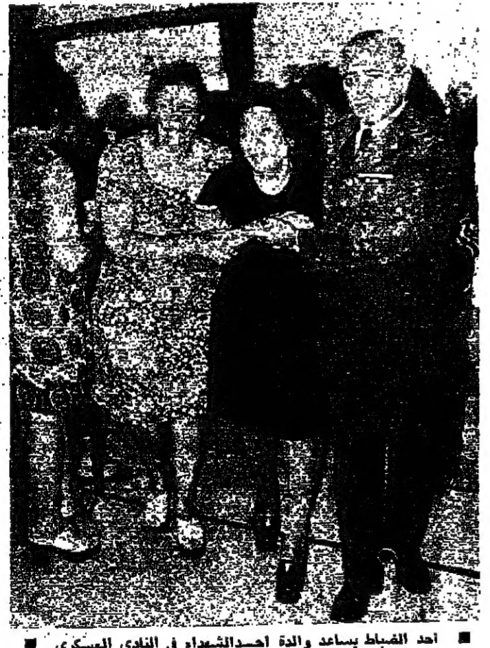
احد الضباط يساعد والدة احدالشهداء في النادي العسكري

وبعد كل ذلك ، ان لاصحاب الجولات ان يبدوا جولة التعقل رحمة بهذا البلد .. وبهم .